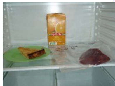
Figure 3 : réfrigérateur commun pour les prélèvements et les denrées alimentaires personnelles