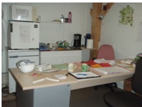
Figure 2 : bureau servant de salle de pause et de local de stockage des prélèvements

Le local à usage de bureau ou de réunion ne doit pas servir de local pour la préparation et l'entreposage des prélèvements (article 3 du R852/2004 [1]) et ne doit pas être considéré comme une salle de pause (R4228-19 du CT) (exemple de non-conformité en figure 2).