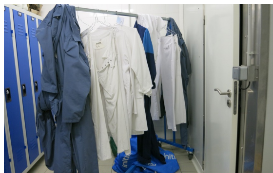
Figure 4 : vestiaire encombré par le portique de linge propre

Un emplacement pour le recueil du linge sale doit être prévu pour éviter de mélanger le linge propre et le linge sale (Annexe II Chapitre VIII §1 du R852/2004 [1]) (exemple de mauvaise pratique en figure 4).